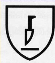
Abb. 4: Piktogramm Stichschutz