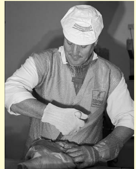
Abb. 2: Ausbearbeiten

Größenkennzeichnung, Bezugsziffer der neuen Norm und Schnitt- oder Stichschutzpiktogramm (vgl. Abb. 1, 3 und 4). Der Praktiker wird in den meisten Fällen nach der neuesten Norm gefertigte Produkte bevorzugen. Das scheint der o. g. Feststellung, dass der Handel seine noch vorhandenen, der alten Norm entsprechenden, Produkte verkaufen darf, auf den ersten Blick zu widersprechen. Die Erklärung ist, dass die Konformität der „alten“ Produkte gegenüber der unveränderten PSA-(Hersteller)-Richtlinie erklärt wurde. Daraus folgt, dass im Handel befindliche Produkte, die zum Zeitpunkt des Inverkehrbringens (= Auslieferung an den Handel) die Konformität besaßen diese auch nicht verlieren, also „aufgebraucht“ werden können.