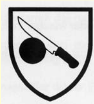
Abb. 3: Piktogramm Schnittschutz