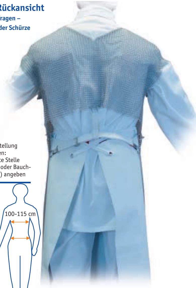
Bolero-Rückansicht Bequemes Tragen – auch unter der Schürze

Bei Bestellung beachten: Breiteste Stelle (Brust- oder Bauch- umfang) angeben