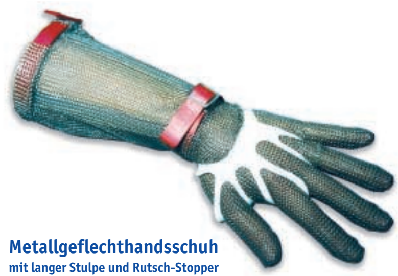
Metallgeflechthandschuh mit langer Stulpe und Rutsch-Stopper