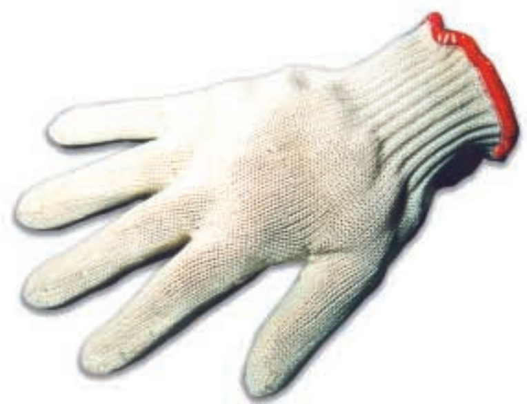
Schnitthemmender Handschuh bei Schneidarbeiten, an der Messerhand