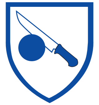
Schnittschutz EN-ISO 13998 bei Kleidung